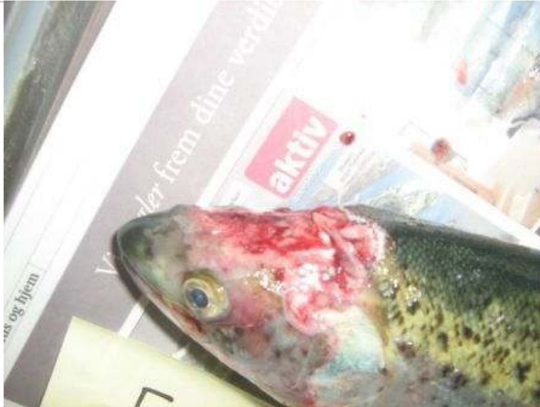
Laks i norsk anlegg 2009