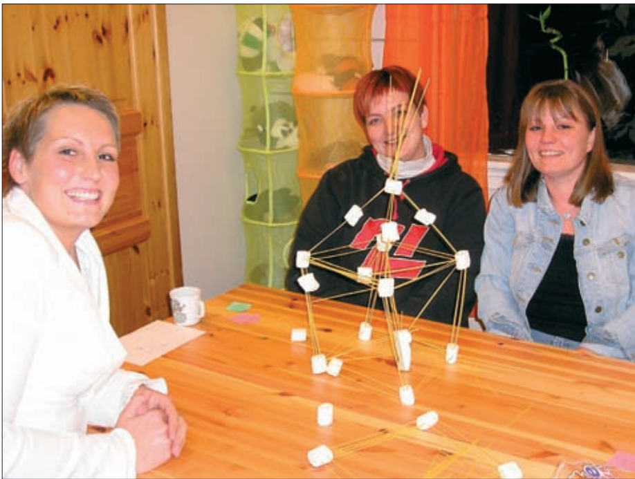
Heilskapleg satsing på entreprenørskap handlar om å møtast i kreativ samhandling. Her er det ei gruppe frå eitt av møta i Halså som prøver dette ut i praksis gjennom bygging av tårn i spagetti og skumputer.

Møreforskning har evaluert tiltaket "Heilskapleg satsing på entreprenørskap som utviklingsstrategi" på oppdrag frå Møre og Romsdal fylke. Satsinga har vore gjennomført som tre sjølvstendige prosjekt i kommunane Halså, Surnadal og Tingvoll. I oppsummeringa av prosjektet heiter det mellom anna: Ambisjonane i prosjektet har vore store, med stikkord som heilskapleg satsing, breidde, samarbeid og nyskaping. Det har vore mange aktivitetar knytte til arbeidet med prosjektet. Det heilskapelege perspektivet har vore mest synleg i forhold til aktivitetar knytte til samspelet mellom næringsliv og skule og lokalsamfunnsprosjekt. Vidare blir det sagt at: Det er gjennom prosjektet gripe tak i eit haldningsskapande arbeid. Dette er viktig arbeid, ikkje minst sett i lys av at det er snakk om eit område av Møre og Romsdal der det i ulike samanhengar har vore uttrykt at det er behov for å endre haldningar og tenkemåtar til næringsutvikling. I prosjektet er det gjort grep som har ført til at ein har kome i gang med eit slikt haldningsskapande arbeid. Dette gjeld tiltak som også er institusjonaliserte, og som slik sett har potensiale for eit liv etter prosjektslutt.